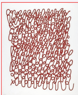
Louise Bourgeois, Crochet I , 1998

Η ημερίδα χρηματοδοτείται από το ΠΜΣ Δέξιππος