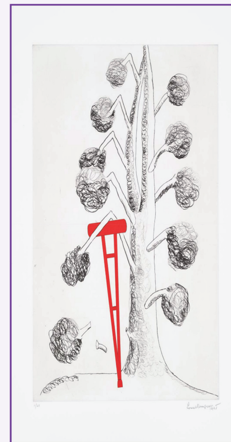
Louise Bourgeois, Tree with Red Crutch , 1998